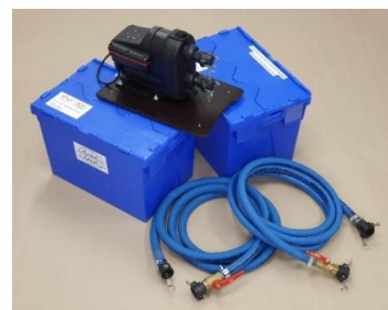
Trycksättningspaket - standardutförande

Med vatten i kranarna blir allt som vanligt igen och toaletter, duschar, diskmaskiner med mera återfår sin normala funktion.